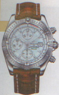
ブライトリング BREITLING クロノマット

存在感のあるスポーティなデザインにMOPダイヤルが映える ブライトリングを代表するスポーティなモデルにMOPダイヤルを採用。大型ケースと存在感のあるスタイリングに光輝くMOPダイヤルが映える。300m防水。自動巻き。ステンレススチールケース。クロコダイルストラップ。63万5250円。問い合わせ/ブライトリング・ジャパン ☎03-3436-0011