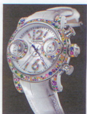
グラハム GRAHAM ソードフィッシュ・アリバ

「パリの石壁」と名付けられた、クラシカルな雰囲気を持つスクエアモデル。手首に沿うように緩やかにカーブしたエレガントなケースに、MOPダイヤルが見事に調和を見せている。自動巻き。ステンレススチールケース。レザーストラップ。44万1000円。問い合わせ/アーム・オルロジュリ (ワールド通商) ☎03-6226-3210