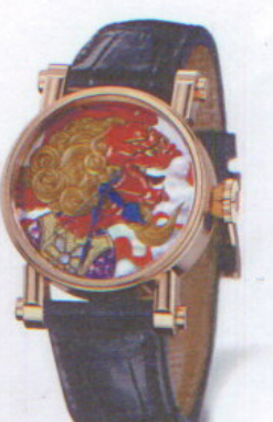
スピーク・マリン SPEAKE-MARIN ヴィジョンアリー・ライオン

200m防水のスポーティなモデルながら、120個のダイヤモンドをセットしたベゼルと疾しく輝くグリーンMOPダイヤルの組み合わせがゴージャス。ジェルストラップがカジュアルな雰囲気を演出している。クロノグラフ。クォーツ。ステンレススチールケース。34万8500円。問い合わせ/テクノタイムジャパン ☎03-3944-2522