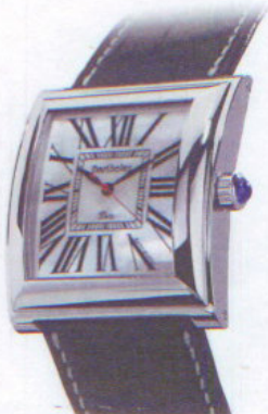
バルトレ BARTHELAY バヴェドバリ

センターのローカルタイムに加え、ブルーMOPで描かれた世界地図には東京、パリ、NY、LAの4都市の時刻を表示する。遊び心に溢れたモデル。世界地図とダイヤルは豪華にダイヤモンドで縁取られている。クォーツ。ステンレススチールケース。アリゲーターストラップ。241万5000円。問い合わせ/ユーロパッション ☎03-5295-0411