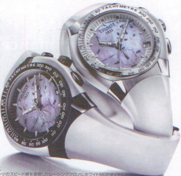
ティソ TISSOT T-トラックス

モータースポーツのスピード感を表現したレーシングクロノにホワイトMOPダイヤルを採用し、シックでクールな仕上がりに。10気圧防水。クォーツ。ステンレススチール+ホワイトファイバーガラスケース。ホワイトラバーストラップ。(左)8万9100円。(右)7万3500円。問い合わせ/スウォッチ グループ ジャパン ティソ事業部 ☎03-6254-7360