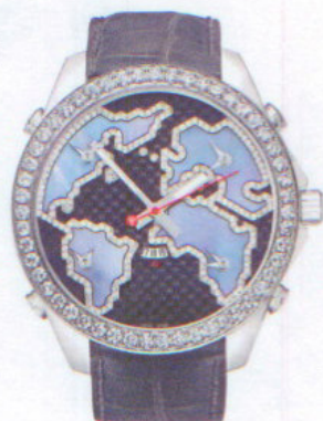
ジェイコブ JACOB & Co.

ホワイトMOPダイヤルを融合 航空機のcockpitに搭載されている計器から着想を得た独特のスクエアケースは、グレーの光沢仕上げのステンレススチールとハイテク・ホワイト・セラミックを使用。ケース幅42mm。100m防水。自動巻き。シンセティック素材によるヘビードューティストラップ。47万2500円。問い合わせ/ワールド通商 ☎03-3549-3011