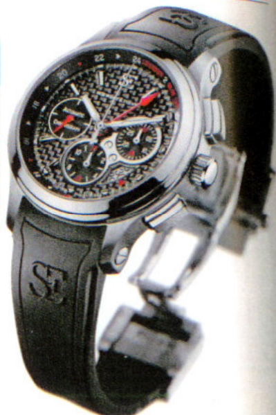
← スピーク・マリン "アンモナイト・フォッシル"

シンプルなか3針式のピカデリー・コレクションに、ワン・オフ・モデルのアンモナイト・フォッシルが加わった。ホワイトMOPの中に化石のアンモナイトを組み込んだスペシャル・ダイアルを装備するのが特徴。18KPGのクラウンを装備したケースはSS製/38mmで、オートマチック・ムーブメントを搭載する。価格は173.25万円で、11月の入荷予定。