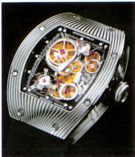
リシャール・ミル "RM018オマージュ・ア・ブシュロン"

ブシュロンとのコラボレーション・モデル。ゴドロン模様が刻まれた縦48.00mm×横39.39mmの18KWGケースに搭載されるのは、歯車にダイヤモンドやオニキス、ジャスパーなどを埋め込んだ新開発のトゥールビヨン・ムーブメントで、それぞれの貴石/半貴石が1個ずつ、合計30種類のパターンが作られる。ムーブメントは手巻き式で、約48時間のパワー・リザーブをもつ。セットされるジュエリーで価格はまちまちだが、虎眼石モデルの価格は7875万円。