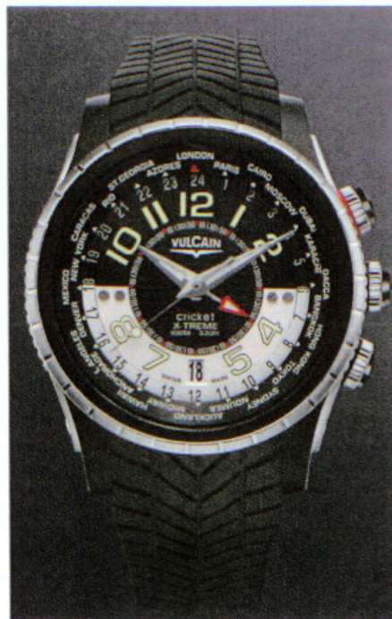
↓ ヴァルカン "Cal.V20"

150周年を記念したニューモデルが、ひとまわり大きな44mmケースを採用したGMTエクストリーム。ケースはブラックTIとSS、TIと18KRGの2種類で、10気圧防水機能とシスルー・ケースバックを装備する。搭載ムーブメントはデイトつきアラームのCal.V16マニュアルで、ブラック/シルバーあるいはシルバー/ブラックのダイアルが用意される。