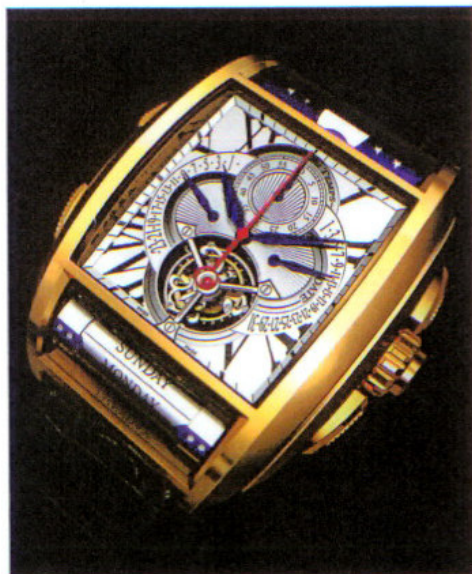
メートル・デュ・タン "チャプター1"

ブシュロンとのコラボレーション・モデル。ゴドロン模様が刻まれた縦48.00mm×横39.39mmの18KWGケースに搭載されるのは、歯車にダイヤモンドやオニキス、ジャスパーなどを埋め込んだ新開発のトゥールビヨン・ムーブメントで、それぞれの貴石/半貴石が1個ずつ、合計30種類のパターンが作られる。ムーブメントは手巻き式で、約48時間のパワー・リザーブをもつ。セットされるジュエリーで価格はまちまちだが、虎眼石モデルの価格は7875万円。