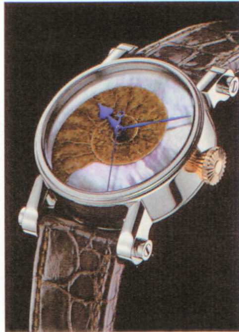
SPEAKE-MARIN 2008NEW MODEL