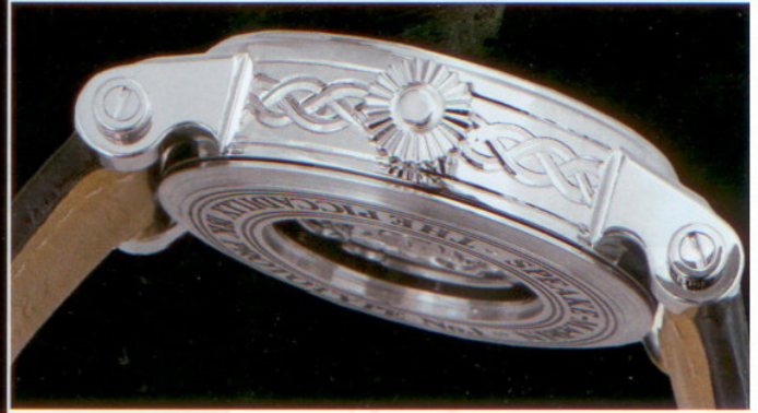
Diese einmalige Ausführung der Piccadilly begeisterte mit ihren kunstvollen Gravuren und Verzierungen in diesem Jahr auf der Basler Messe. Die Sonderversion in Weißgold ist bereits ausverkauft.