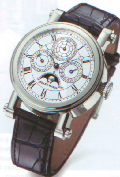
»Unique«: Die Minutenrepetition mit Ewigem Kalendarium und Tourbillon hat den stolzen Preis von 585 000 Dollar.

die Zeiger nach alter Tradition gebläut. In feiner Symmetrie zum Stundenring steht der Tourbillonkäfig, der einmal in der Minute rotiert. Langlebigkeit und Schönheit seien die Zielsetzung für die Foundation Watch, resümiert der englische Uhrmacher.