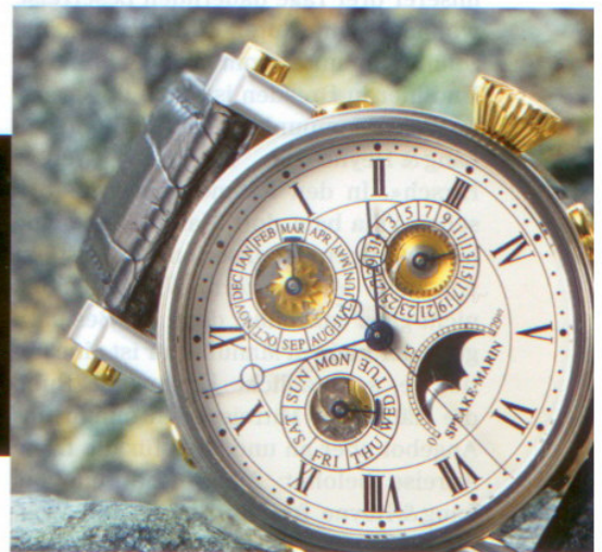
Diese teilskelettierte Ausführung stellt in den Hilfszifferblättern des Ewigen Kalenders die Mechanik zur Schau. Preis: 42 500 CHF.