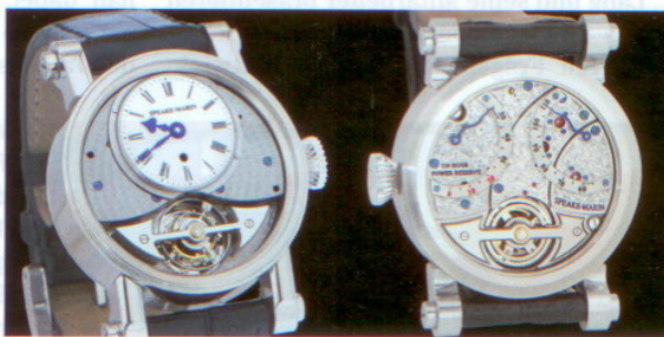
Das »Vintage Tourbillon« in Weißgold indiziert bei sechs Uhr die letzten 24 Stunden der ablaufenden Gangreserve. Unten der filigrane Tourbillonkäfig. Preis: 19 300 CHF.