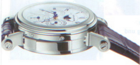
Die Seitenansicht zeigt den komplexen Aufbau der Habillage. Gehäuse und Stege sind so konstruiert, dass Revision und Bandwechsel ganz einfach vonstatten gehen.