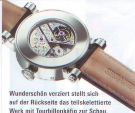
Wunderschön verziert stellt sich auf der Rückseite das teilskelettierte Werk mit Tourbillonkäfig zur Schau.